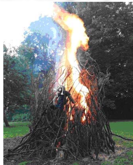
Sankt Hans bål i Præstegårdshaven