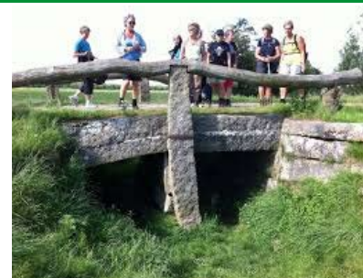
Pilgrimme og hærvejsvandrere