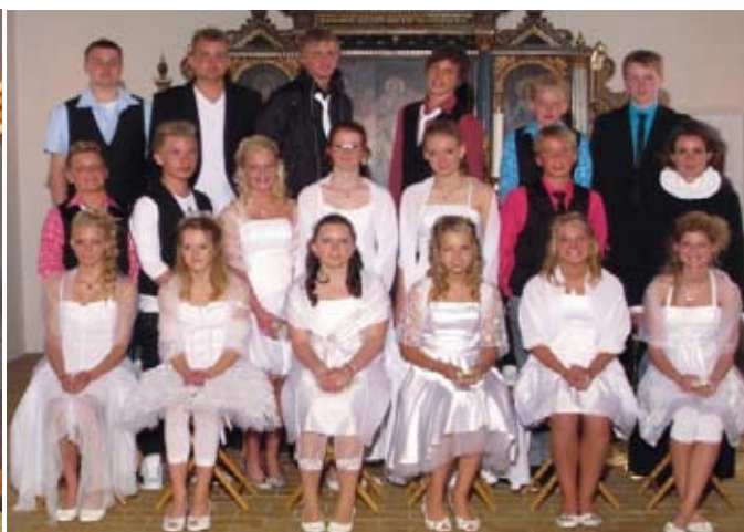
Vojens Kirke den 21. maj 2009 kl. 11.00