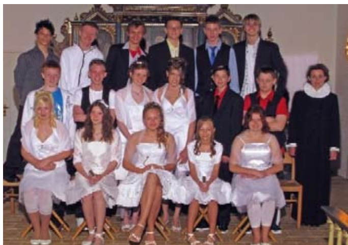
Vojens Kirke den 21. maj 2009 kl. 09.00