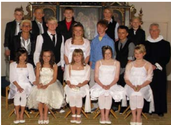
Vojens Kirke den 8. maj 2009 kl. 11.00