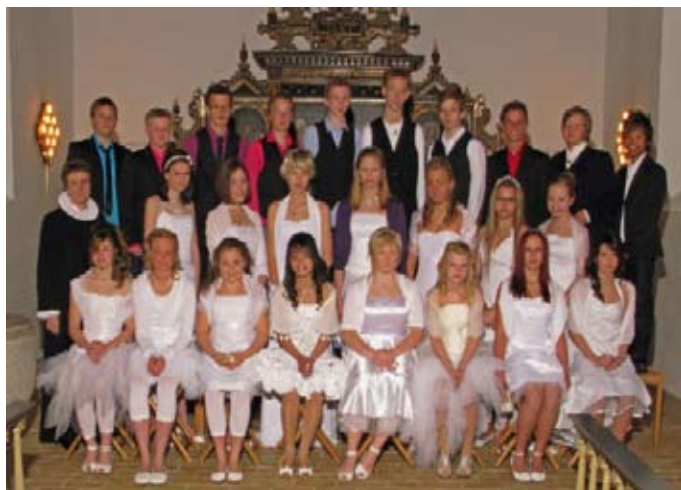
Vojens Kirke den 8. maj 2009 kl. 09.00