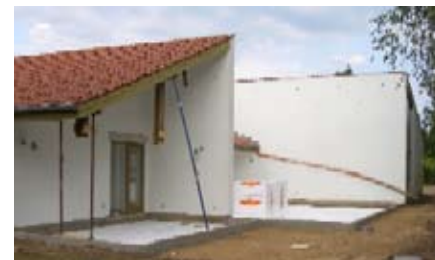
Tilbygningen mod syd