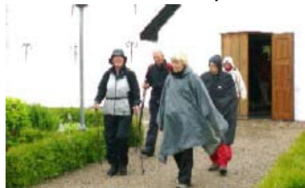
Afgang til pilgrimsvandring sidste år