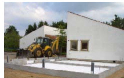
Tilbygningen mod nord er i gang