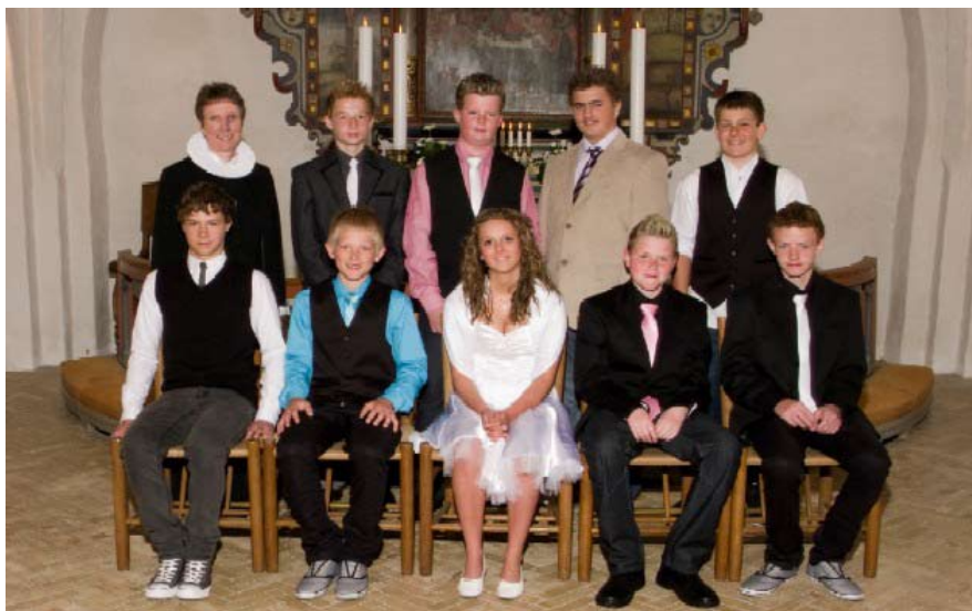
Maugstrup Kirke den 3. maj 2009 kl. 10.00