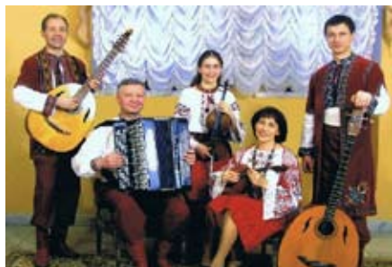
Det ukrainske folkemusikensemble Dyvohray