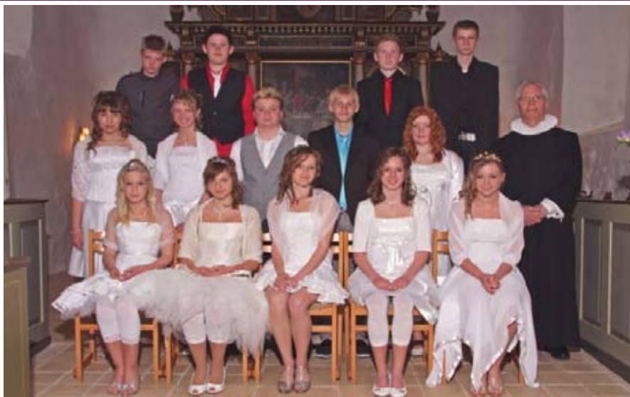
Jegerup Kirke den 8. maj 2009 kl. 09.00