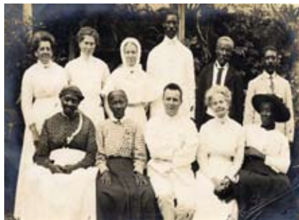
Menighedsrådet ved den lutherske kirke i Christiansted i 1913.

Emne: Fra slaveri til frihed. Dansk Vestindien 1672-1917 Foredrag med billeder fra Dansk Vestindien.