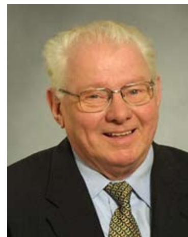
Kaj Ikast, Gram, fhv. minister