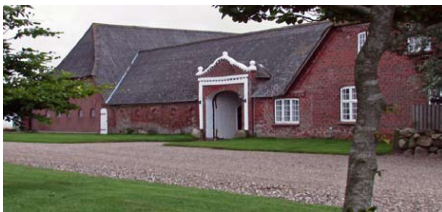
"Den Gamle Digegeves Gård" hvor vi spiser en middag.