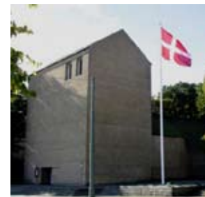
Ansgar Kirke i Flensborg

Har man ikke selv mulighed for at køre, meldes dette også til kirkekontoret, og så vil man blive kontaktet.