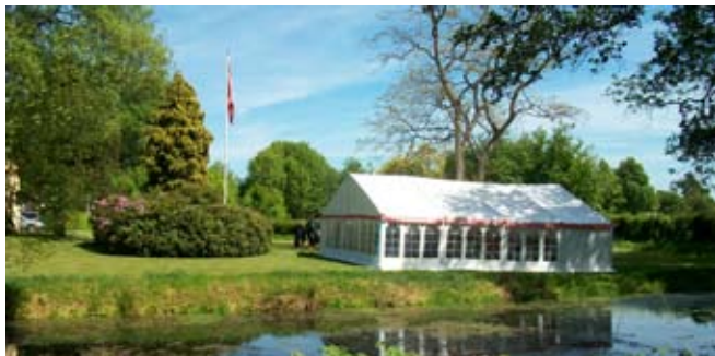
Teltet i præstegårdshaven