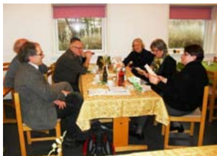
Der blev udvekslet mange gode oplevelser og erfaringer under kirkefrokosten i præstegården.

Det blev til en hyggelig dag med gode samtaler, udveksling af oplevelser og ikke mindst en geninvitation til at besøge dem i Flensborg.