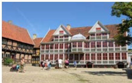
Motiv fra Den Gamle By i Århus