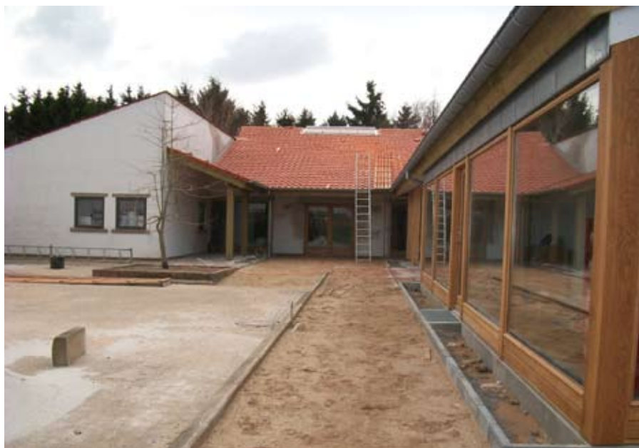
Indgangspartiet til Vojens Sognegård med kontoret for kordegn og præsterne, og i baggrunden indgang til mødelokaler, hvor der er 4 sale til aktiviteter for sognenes beboere i tresognspastoratet

Søndag den 30. maj indbydes der til indvielsesfest i den ny sognegård i Vojens.