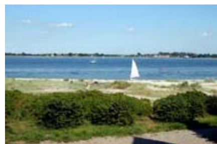
Havudsigten ved Årøsund Badehotel