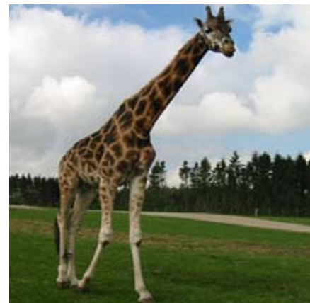
Motiv fra Givskud Dyrepark