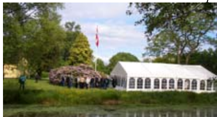
Teltet i præstegårdshaven