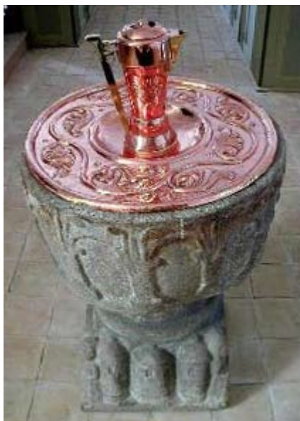
Døbefonten i Jegerup Kirke kan dateres tilbage til år 1050