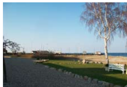
Stranden bag Årøsund Badehotel