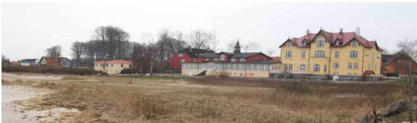
Stranden foran Årøsund Badehotel, hvor pinsegudstjenesten kommer til at foregå

Også i år er sognene i Haderslev Domprovsti gået sammen om en fælles friluftsgudstjeneste Anden Pinsedag den 24. maj.