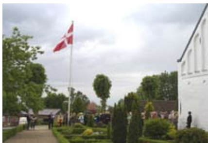
Flaghejsning i 2009