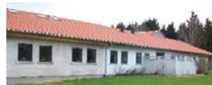
Sognegården mod vest