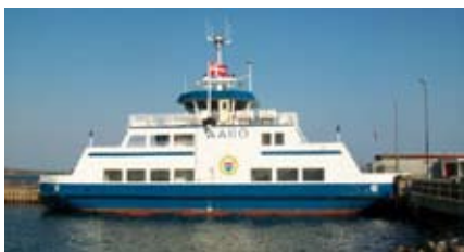
Færgeforbindelsen til Årø

Der er en særlig hjemmeside hvor der kan hentes mere information: