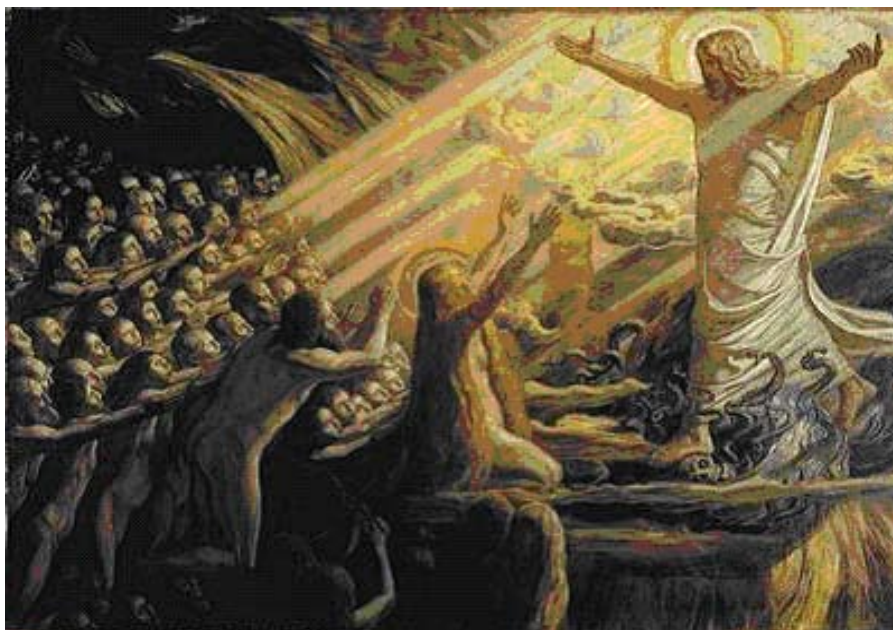
Joakim Skovgaard: Kristus i de dødes rige (1891-94). Statens Museum for Kunst

Vi vil gerne have et problemfrit og succesrigt liv. Selv om vi gør os de hæderligste anstrengelser, så er der lidelse i vores liv – lidelse som vi ikke sådan bliver færdig med. Der kan være episoder, vi har oplevet, som vi ville ønske,