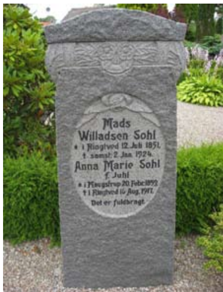
Granitsten udhugget i skønvirkestil