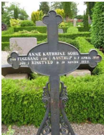
Kors i smedejern