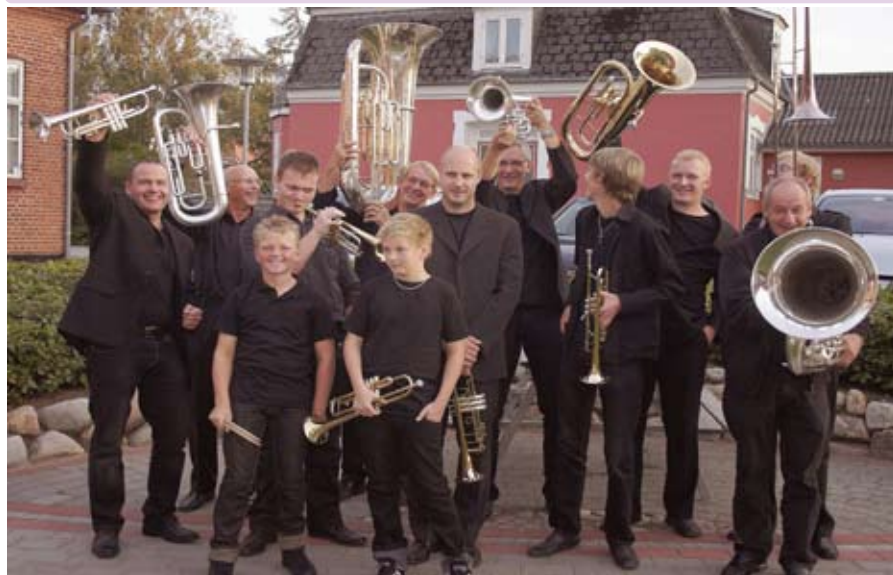
LM Brass Band